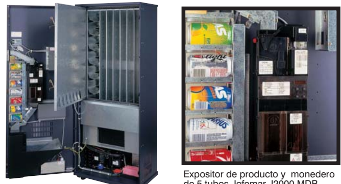
Expositor de producto y monedero de 5 tubos Jofemar J2000 MDB Expositor do produto e porta-moedas de 5 tubos Jofemar J2000 MDB