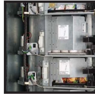
Tambores horizontales con espiral interna Tambores horizontais com espiral interna