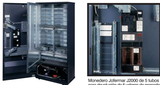
Monedero Jofemar J2000 de 5 tubos para devolución de 5 valores de moneda Porta-moedas Jofemar J2000 de 5 tubos para devolución de 5 valores de moneda