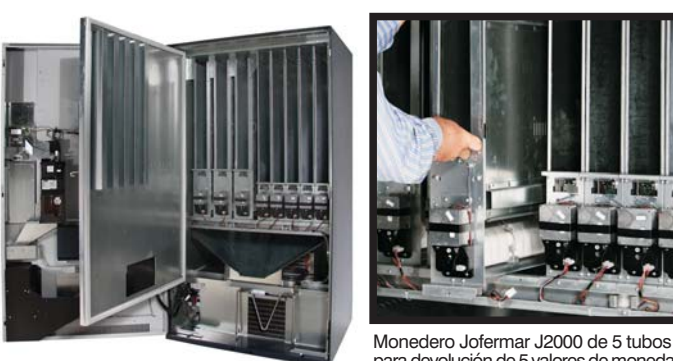
Monedero Jofemar J2000 de 5 tubos para devolución de 5 valores de moneda Porta-moedas Jofemar J2000 de 5 tubos para devolución de 5 valores de moneda